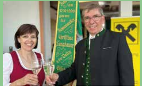
Fronleichnam Frühshoppen ÖKB