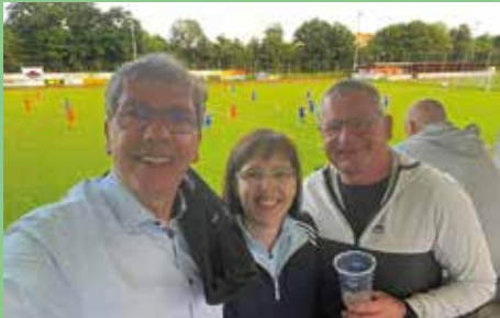
Heimspiel – Sieg 3:0