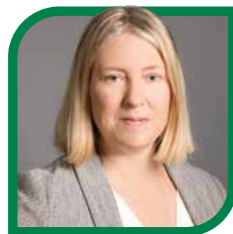
GR in HELENE RUHMER