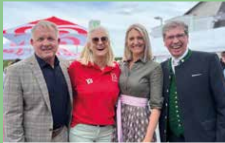
60 Jahre Apotheke Kalsdorf